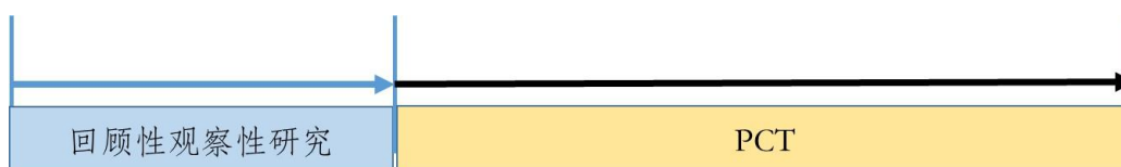
图3 已有人用经验中药临床研发的路径之二

观察性研究与PCT研究相结合的路径如图3所示，第一阶段先开展回顾性观察性研究，如果得出该药品在临床应用中对患者具有潜在获益，可以进入下一研究阶段，否则研究终止。第二阶段开展PCT研究，它所提供的证据可以用于支持其临床有效性和安全性的评价。